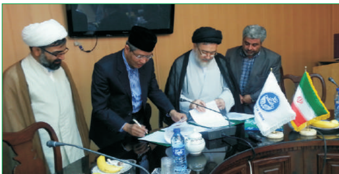
Penandatanganan MoU antara Institut PTIQ dengan Teheran University

Maraknya pertentangan antargolongan (antarmazhab) di berbagai negara Islam akhir-akhir ini menimbulkan banyak ekkses negatif seperti saling memfitnah, mengkafirkan, dan saling menghalalkan darah antarmereka, mengusik banyak kalangan dan lembaga di dunia untuk mengintensifkan dialog antarmazhab. Ke hal-2